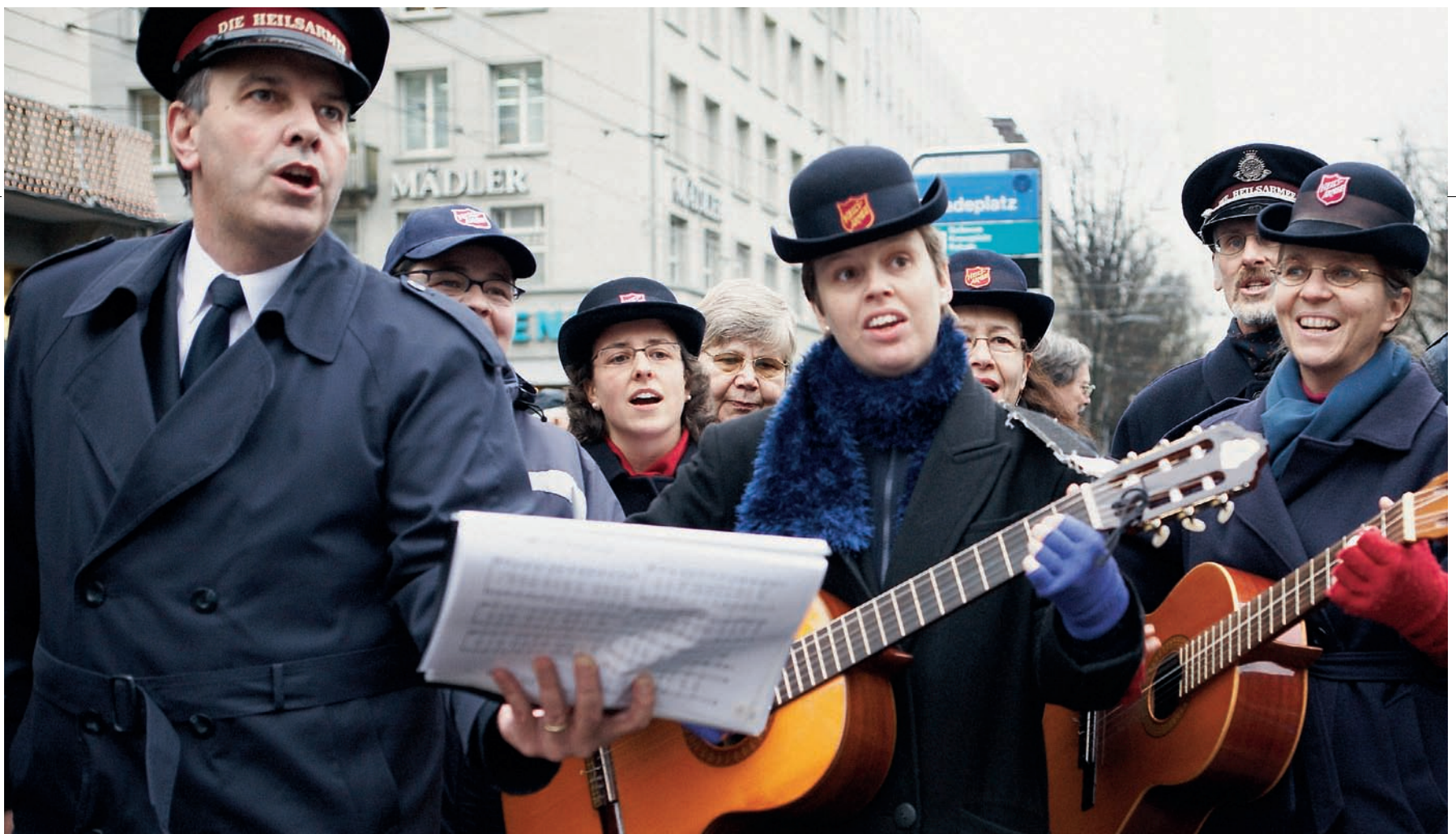
Singen macht glücklich: Wer sich wie die Heilsarmisten für eine gute Sache engagiert, ist zufriedener mit dem eigenen Leben.

Nun ist es schön und gut zu wissen, was dazu beiträgt, glücklich zu werden. Doch wozu dient das Ganze? Und ist es nicht ein wenig frivol, wenn sich Psychologen mit der Suche nach dem Glück beschäftigen, statt mit der Erforschung und Therapie psychischer Erkrankungen? Ganz und gar nicht, findet Ruch: «Zum Leben des Menschen gehören nicht nur die psychischen Krankheiten, mit denen sich die Psychologie lange Zeit vor allem beschäftigt hat, sondern auch positive Aspekte wie Stärke, Wachstum, Glück oder Kreativität.» Die Positive Psychologie definiert sich als Gegenpol zu den an den Defiziten orientierten Ansätzen, wie sie in der Psychopathologie, aber auch der Diagnostik