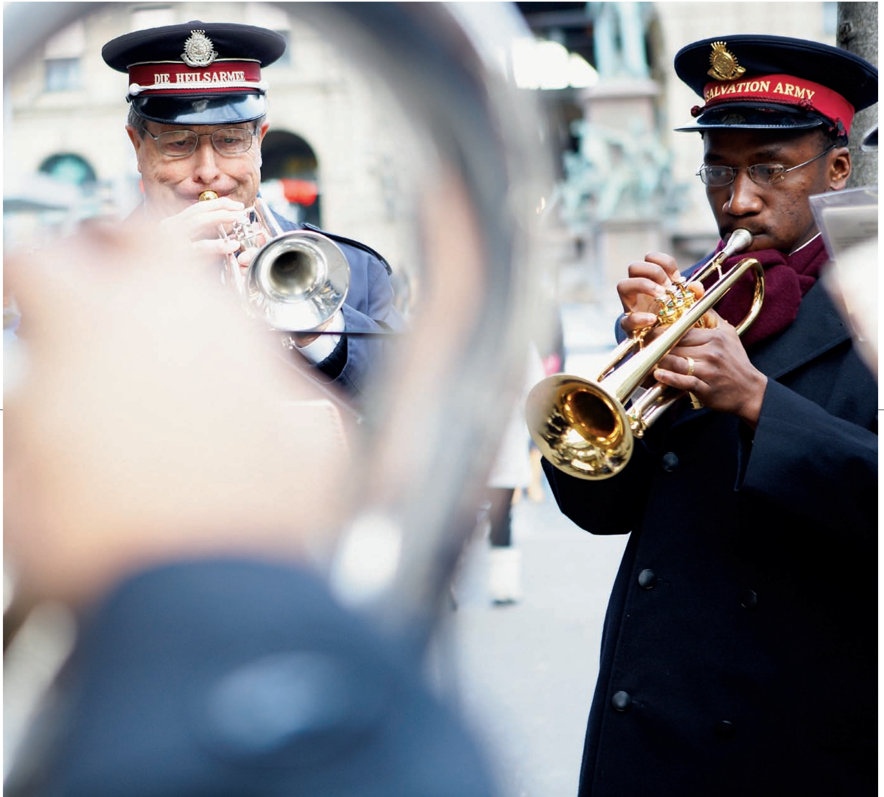
... sammelt Geld für Bedürftige. Sich in den Dienst einer höheren Sache zu stellen ist eine Möglichkeit, seinem Leben Sinn zu geben.